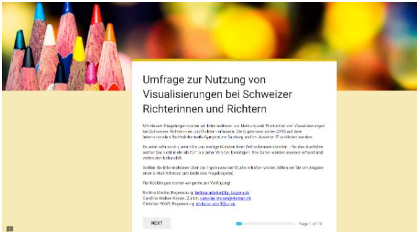
Abbildung 1: Screenshot der Umfrage auf Google Forms (Startbildschirm)

Die Teilnehmerinnen und Teilnehmer der Umfrage konnten über einen Link die Umfrage ausfüllen. Insgesamt haben 117 Personen an der Umfrage teilgenommen, was einer Rücklaufquote von 22,5% bezogen auf die Zahl der konkret angeschriebenen Adressaten entspricht, ein für eine derartige Umfrage sehr guter Wert. Die Datenbank der beim Europarat angesiedelten europäischen Kommission für Effizienz im Justizwesen ( European Commission for the Efficiency of Justice (CEPEJ) ) weist nach den neuesten verfügbaren Daten aus dem Jahr 2014 1'290 Berufsrichter für die Schweiz aus. 5 Somit haben 9,1% aller Berufsrichter an der Umfrage teilgenommen.